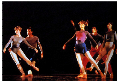
© Merce Cunningham un demi-siècle de danse / chronique et commentaires de David Vaughan